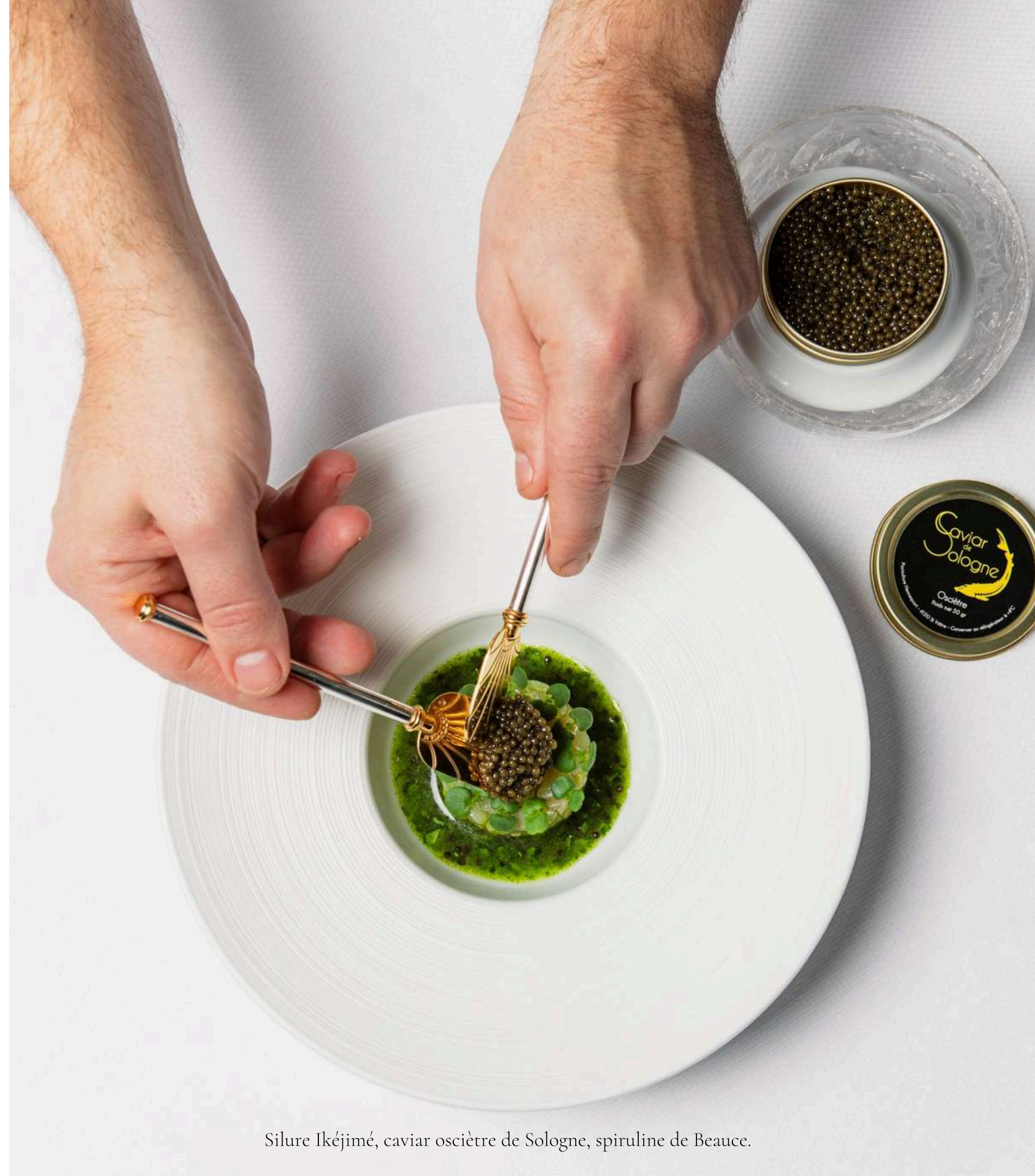
Silure Ikéjímé, caviar osciètre de Sologne, spiruline de Beauce.