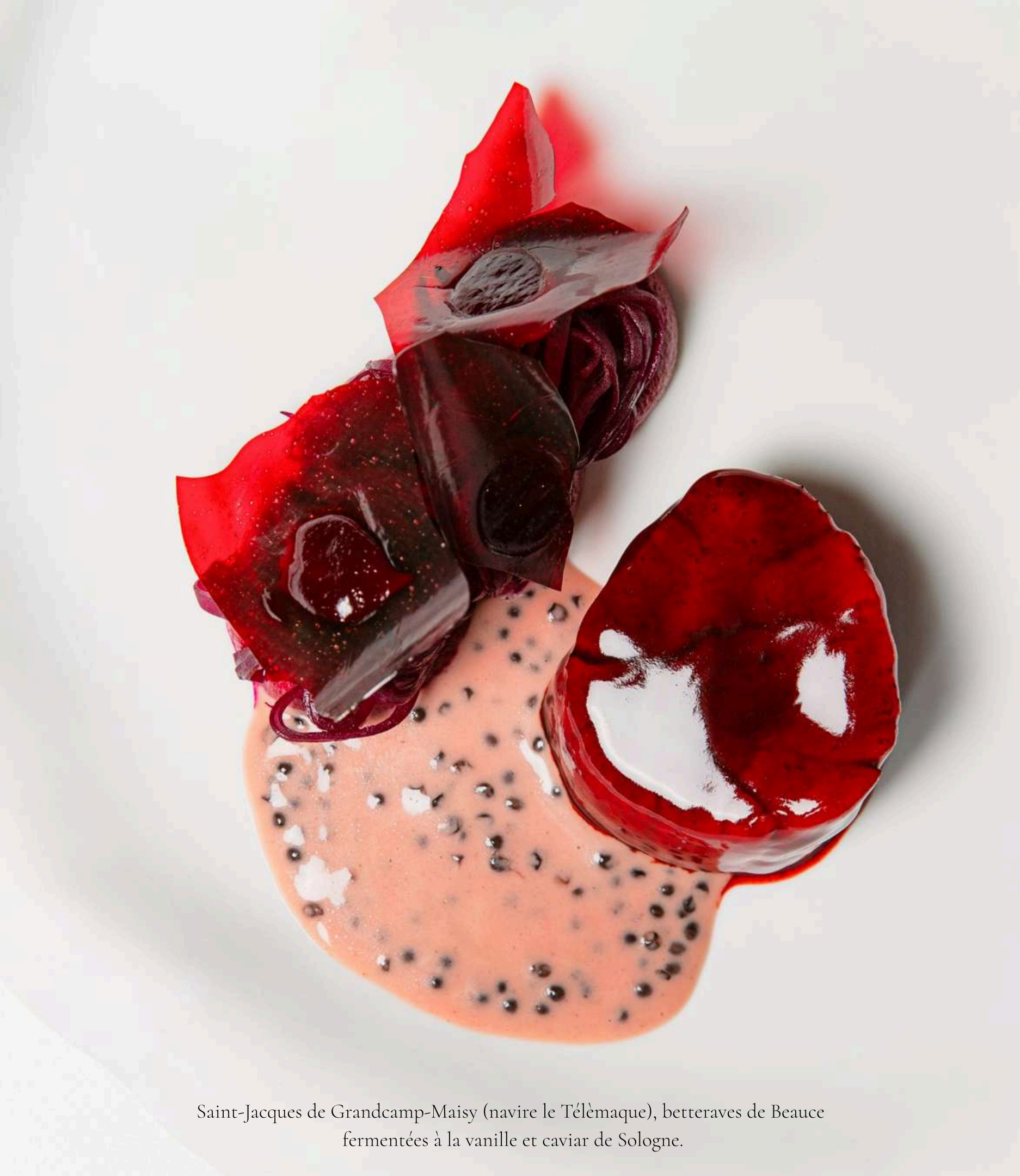
Saint-Jacques de Grandcamp-Maisy (navire le Télèmaque), betteraves de Beauce fermentées à la vanille et caviar de Sologne.